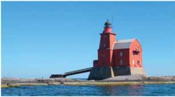
Kallbådan är en av våra ståtligaste fyrar, nu får vi en bok om den!