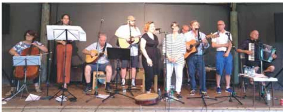
Pihasoittajat på Rigårdsnäs.

Sommarens musik- och kulturprogram inleddes lördagen den 8 juni med en "come back" av Pihasoittajat på danslaven. Den välsjungande musikgruppen är ju känd för sin irländskt influerade musik och Eurovisionslåten Viulu-ukko (1975). Publiken kände igen många av låtarna från året tidigare. Det blev en glad och musikalisk lördagseftermiddag på Rigårdsnäs.