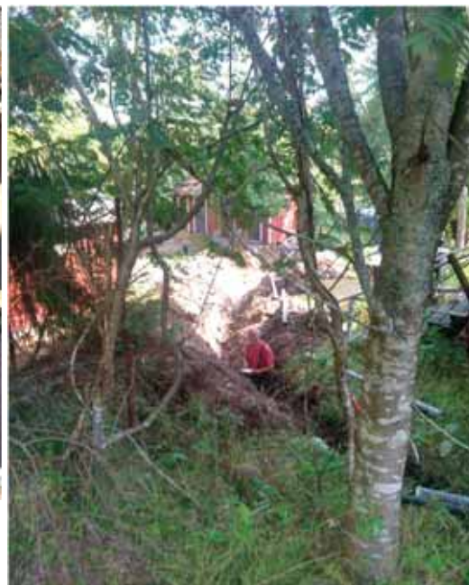
Överst till vänster: De nya avloppsanläggningarna från köket uppfyller nu alla nya krav.