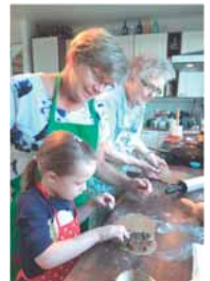
Det vankar mot jul! Tre generationer i julstök.