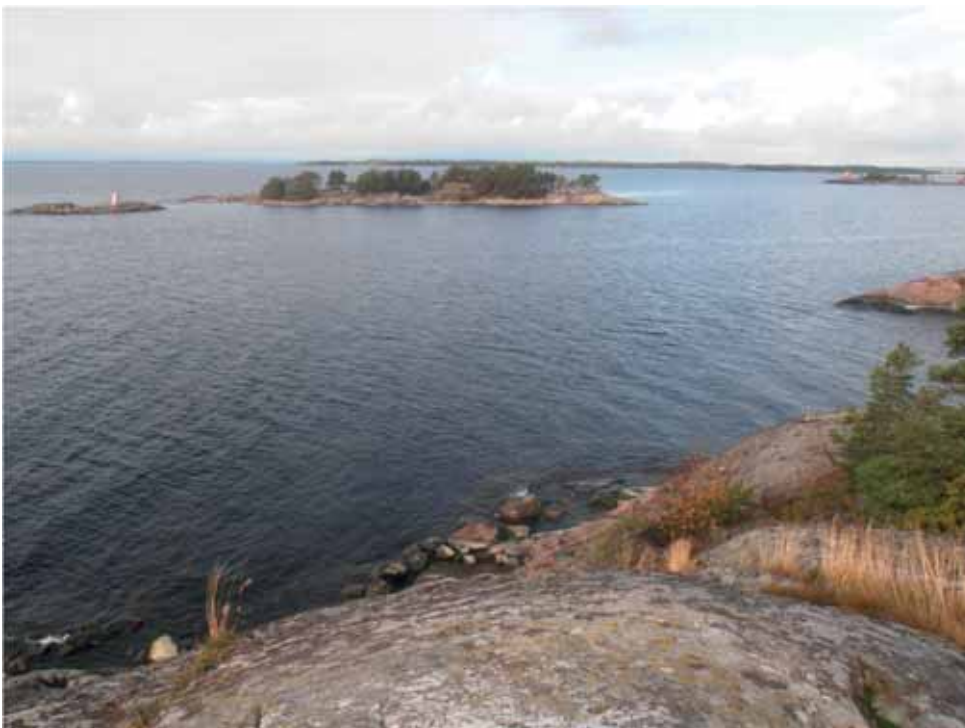
Grällsgrundet, sett från Pampskatan mot väster.