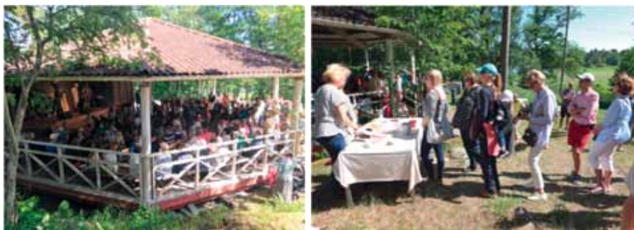
Danslaven var fullsatt med glada och dansande barn när Arne Alligator uppträdde. Kön till våfflor tog inte slut förrän också våfflor var det.

Nedan till höger: Sommarfesten var välbesökt i det strålande solskenet.