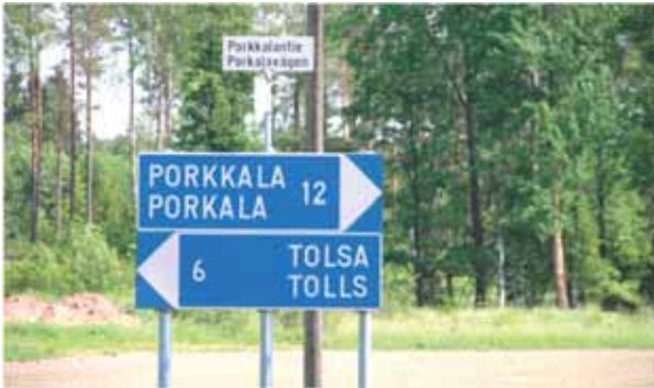
12 km till Porkkala?