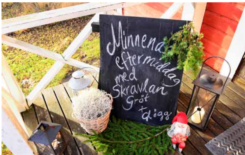
En glad tomte och skojig skylt hälsade medlemmarna välkomna.

Eftermiddagen hade hunnit övergå i en mörk senhöstkvald innan de pratglada medlemmarna hade diskuterat färdigt minnena för den här gången. Vi får återkomma med mera minnen igen senare!