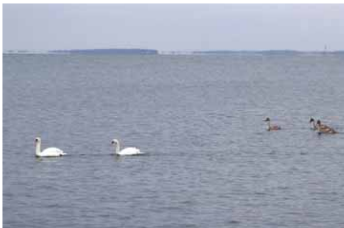
Svanfamilj utanför Pampskatan på nyårsdagen 2016

Svanarna har övervintrat för andra vintern i rad i ett isfritt hav utanför Porkala. De sista snöplättarna smälter bort som smör i vårregnet och de första fästingarna har redan påträffats - akta er för dem också i år! Och så här i medlet av april är det dags för det säkraste vårtecknet, d.v.s. det exemplaret av Vassbuken som du håller i handen nu. Snart är det vår på riktigt, sedan kommer båtarna ut och så puttrar det behagligt ute på fjärdarna igen.