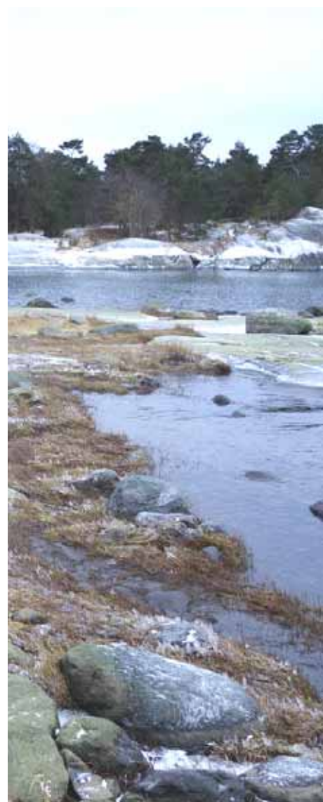
Pampskatan, januari 2016.

Det är skäl att ännu konstatera att detta är miljöministerns förslag till regeringen, beslutet har inte ännu fattats. Porkala följer därför noggrant med den fortsatta beslutsfattningen och också med alla andra planläggningsfrågor som berör Porkala.