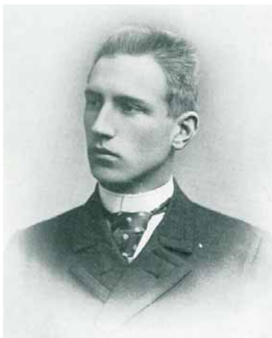
Arvid Mörne, en av våra stora sekelskiftetsdiktare. Bilden av den unge Mörne är från P. O. Barcks bok "Arvid Mörne och sekelskiftets Finland".

Efter symposiet ordnas dessutom en medlemsfest, reservera alltså både eftermiddagen och kvällen! Mera information senare!